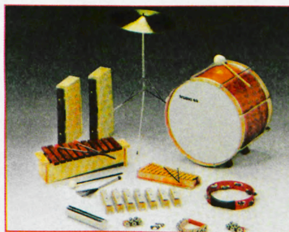
Εικόνα 4.3.γ Μουσικά όργανα για νήπια