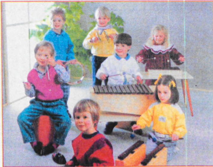
Εικόνα 4.3.α Παίζοντας μουσική

Βασικός στόχος εφαρμογής της βάσει του Αναλυτικού Προγράμματος της Προσχολικής Αγωγής είναι "η ανάπτυξη του μουσικού αισθητηρίου και της δημιουργικότητας των νηπίων στα πλαίσια της γενικότερης ανάπτυξης της προσωπικότητάς, καθώς και η απόλαυση και η χαρά που προκύπτει από τη μουσική έκφραση". Η μουσική είναι κίνηση/ ρυθμός και ήχος και τα παιδιά έχοντας την τάση να μιμούνται τους ήχους και τις κινήσεις που παρατηρούν γύρω τους βρίσκουν μέσα στη μουσική, είτε αυτή έχει συνοδευτικό χαρακτήρα στις διάφορες δραστηριότητες είτε αποτελεί η ίδια το πλαίσιο μιας οργανωμένης δραστηριότητας, έναν αυθόρμητο και προσωπικό τρόπο έκφρασης.